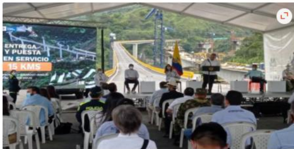
1/1 Alerta Tolima La Cariñosa Ibagué