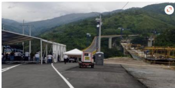
1/1 Alerta Tolima La Cariñosa Ibagué